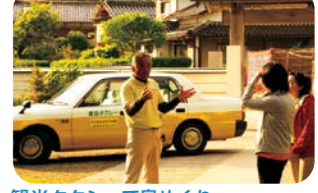
観光タクシーで島めぐり