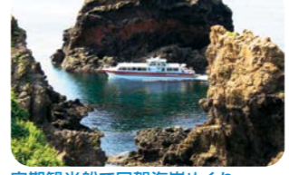
定期観光船で国賀海岸めぐり