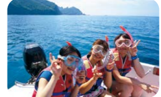
シュノーケリング