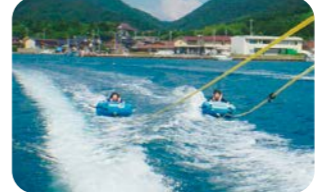
スプリッター、バナナボートなど