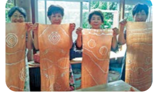
隠岐の土で泥染め