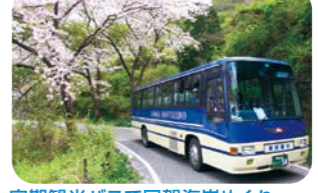
定期観光バスで国賀海岸めぐり