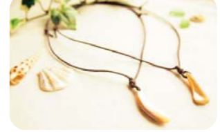
アワビ殻アクセサリー作り