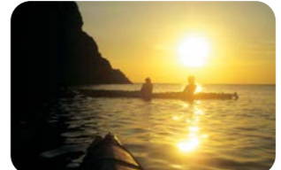
サンセットシーカヤック