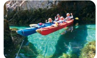
洞窟探検シーカヤック