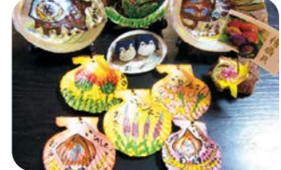
貝細工 (絵付け、フォトフレーム等)