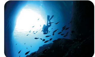
ダイビング (体験、ファン、ナイト)